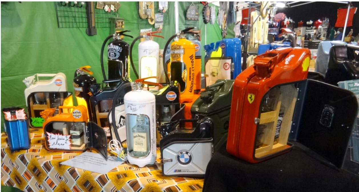
Une deuxième vie pour les Jerricans ou extincteurs, bonne idée !