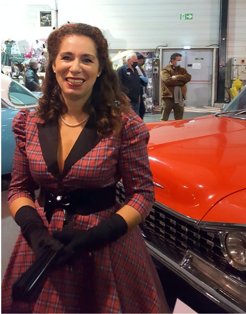
Ah ! le sourire des femmes...