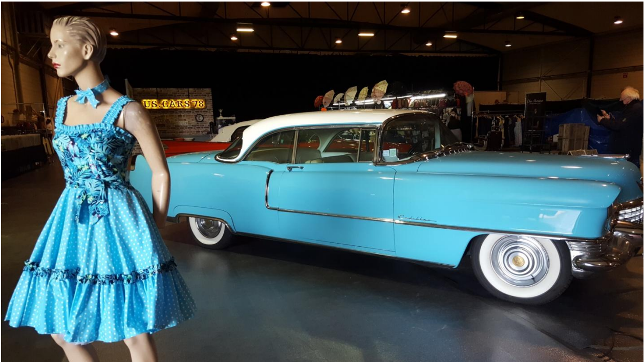
Difficile de faire mieux !