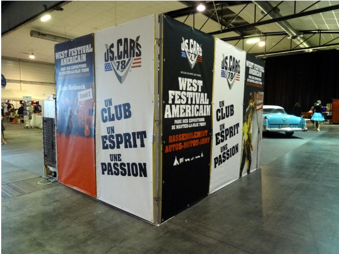
L'envers du décor, attirant lui aussi !