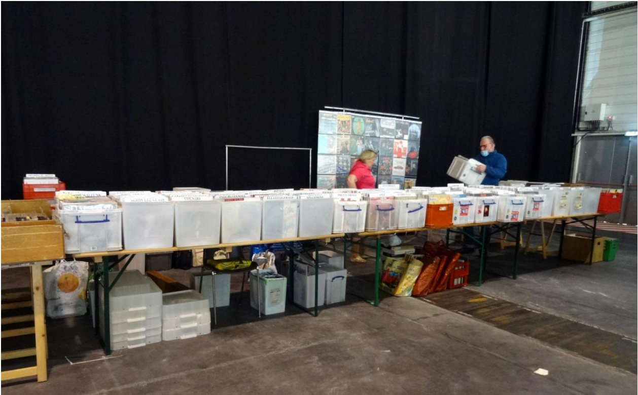
Des mètres de vinyles et pour ceux qui étaient « fourré » au café, le Flipper et le Babyfoot