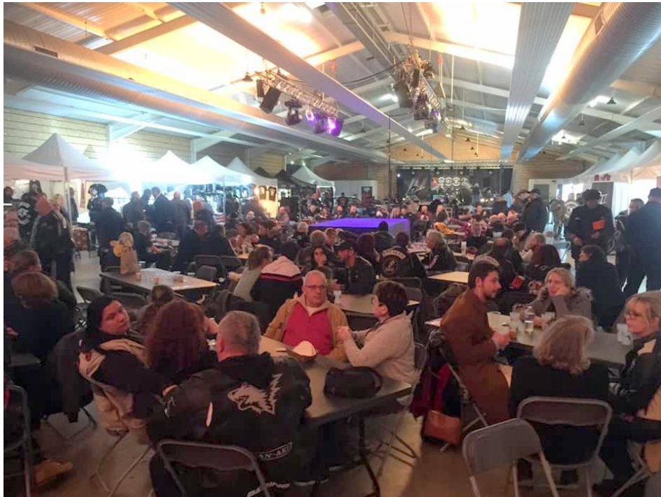
Début de soirée, la salle est déjà bien remplie