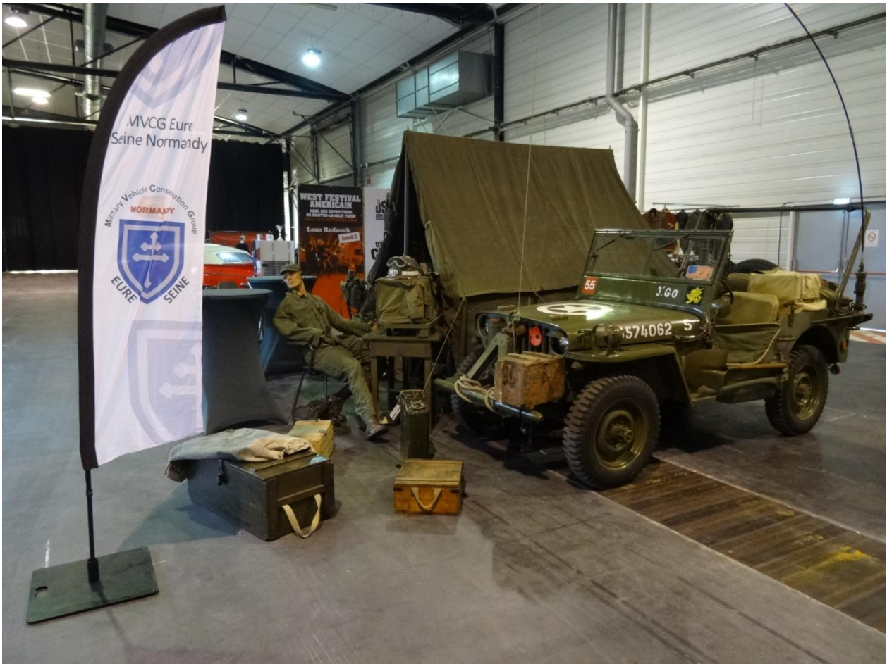
Était présent le Military Vehicle Conservation Group Eure Seine Normandy