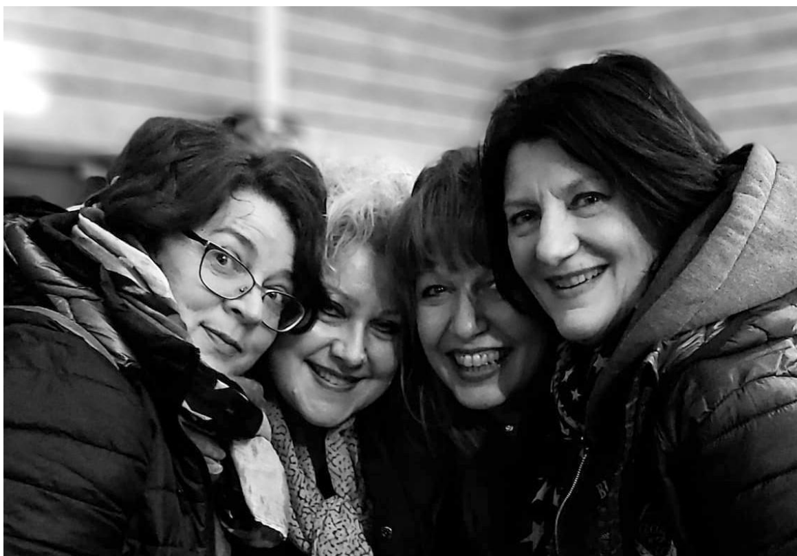
On prend les mêmes et on recommence, merci les filles !