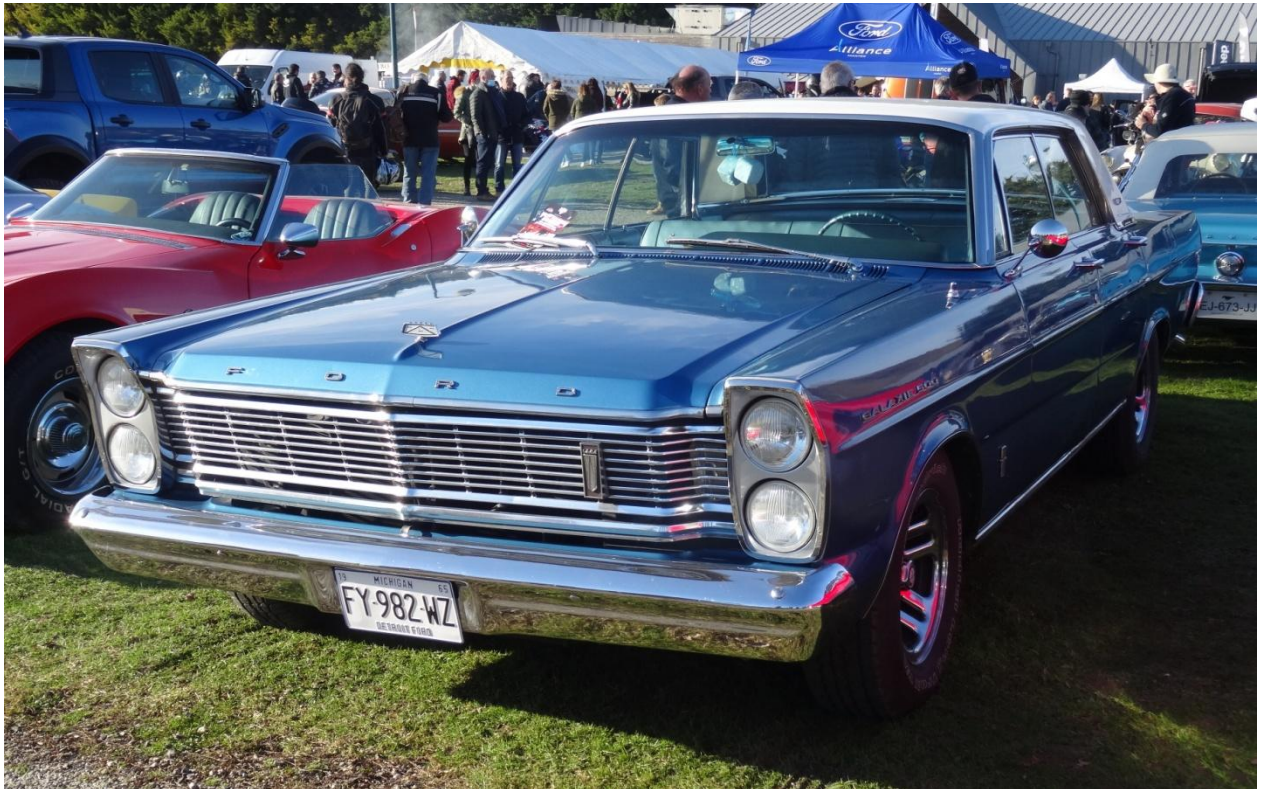
Toute juste arrivée au club, la Ford Galaxie 500 d'Aline