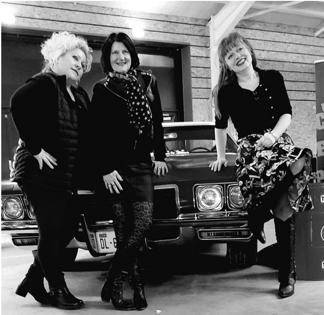
Sympathique le cliché, d'époque ?