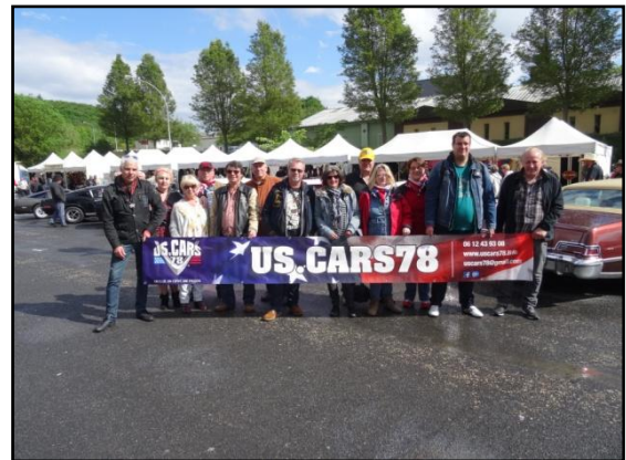
La banderole flotte sur la Normandie

Ainsi, nous quittons les lieux et rejoignons Saint Valéry en Caux où nous décidons de nous y arrêter afin d'y faire une pause. Nous trouvons l'endroit idéal en bout de jetée pour garer nos montures. Face à la mer, nous sortons chaises et table afin d'apprécier ce court moment de détente.