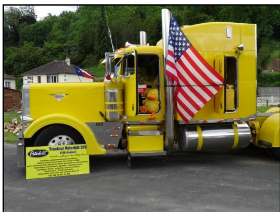
Une belle bête de 600cv !