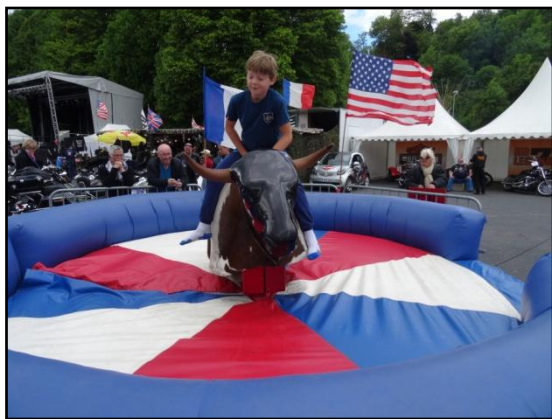
Tiens bon la barre !