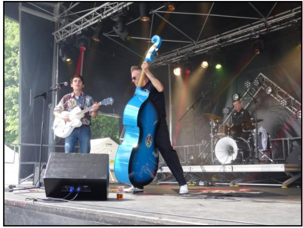
Le groupe les « Hot Slap »