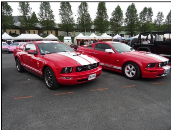
Les sœurs jumelles