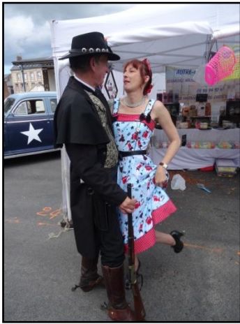
T'as d'beaux yeux, tu sais !