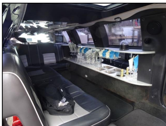
« The » Palace roulant pour jeunes mariés

Nous passons une agréable journée dans ce village malgré une petite « pissée » qui menaçait. Vers 17h, nous « marquons notre territoire » en déployant notre banderole fétiche, photo souvenir.