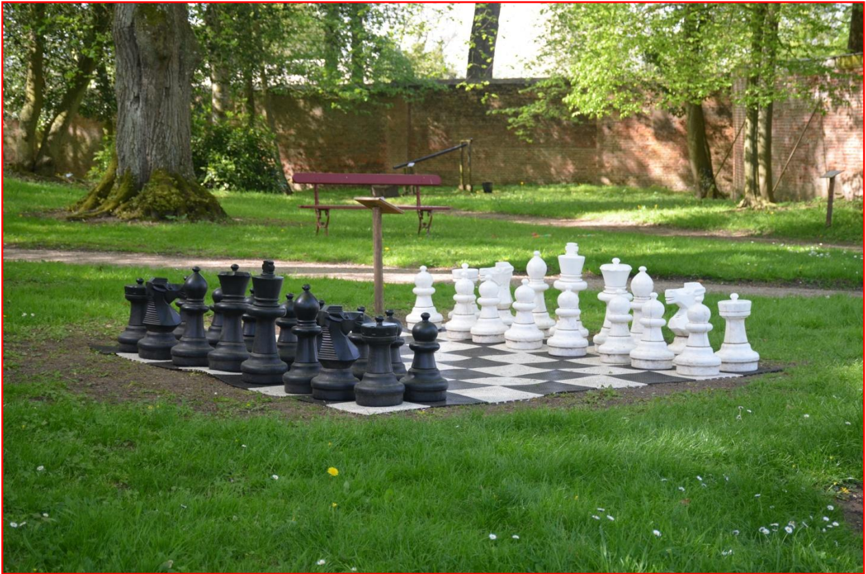
Jeu d'échecs géant pour adultes