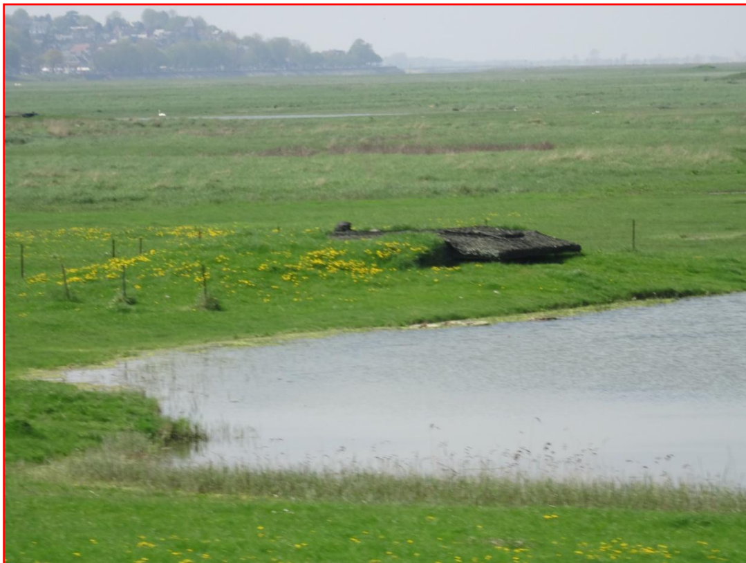
Une hutte de chasse