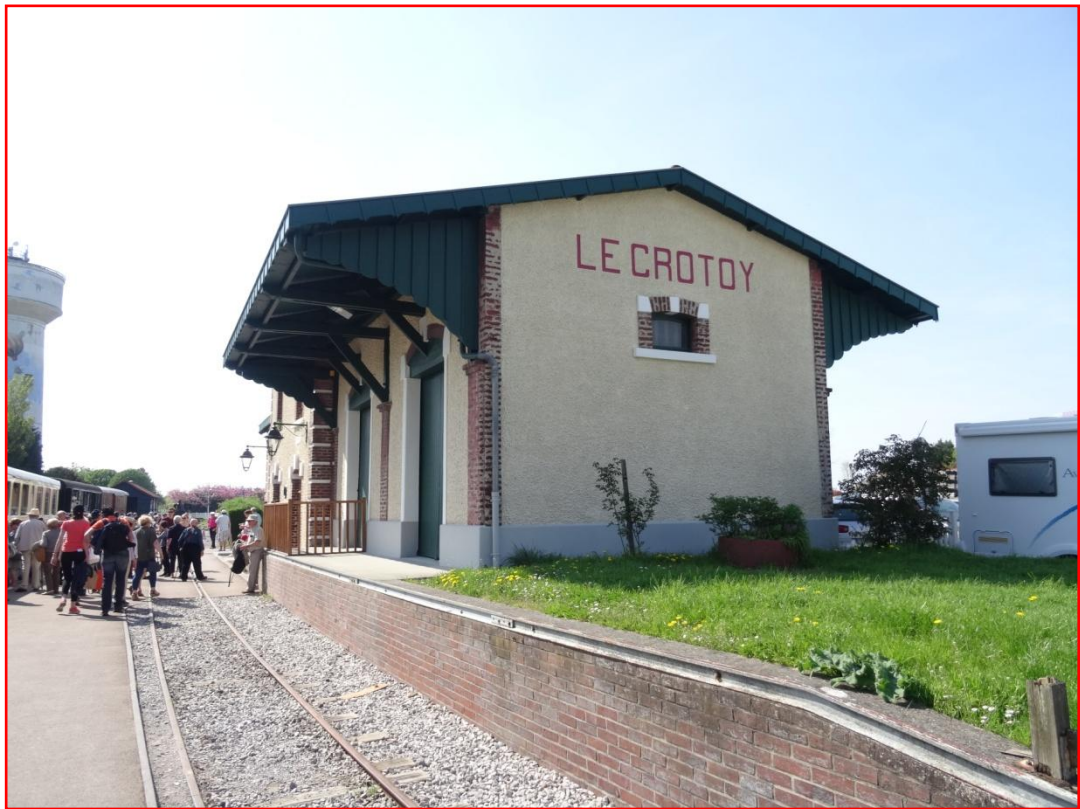
L'arrivée en gare du Crotoy