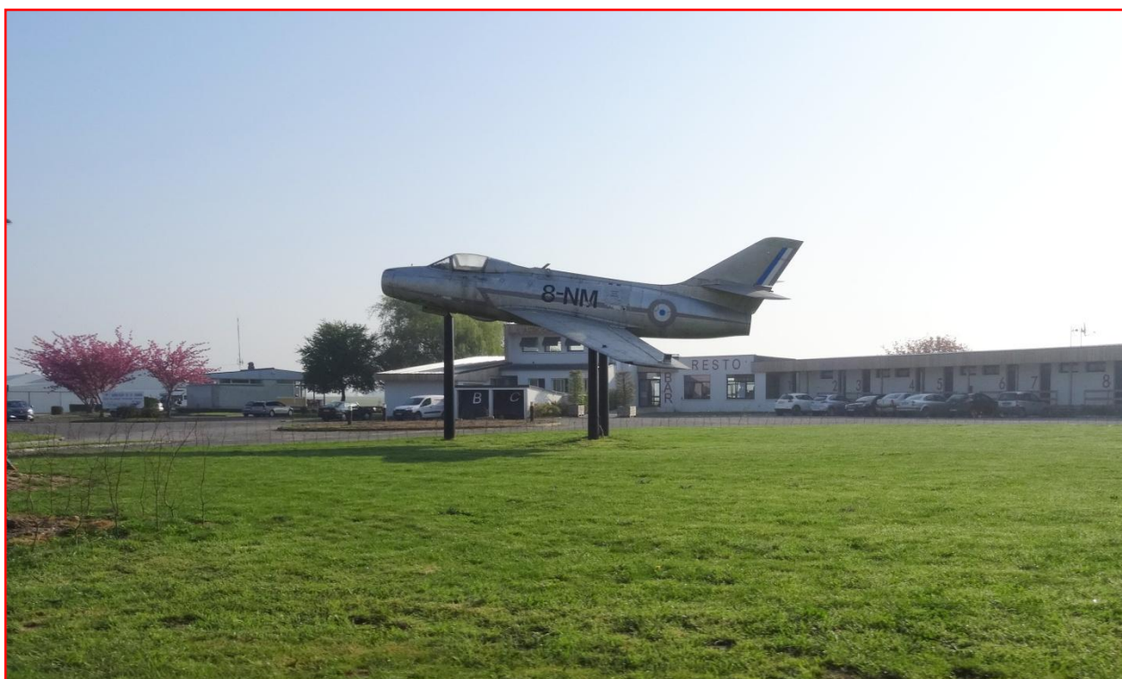
Une partie du Quiz, quel est cet avion ? La réponse, un Mystère IV A propulsé par un HS Verdon