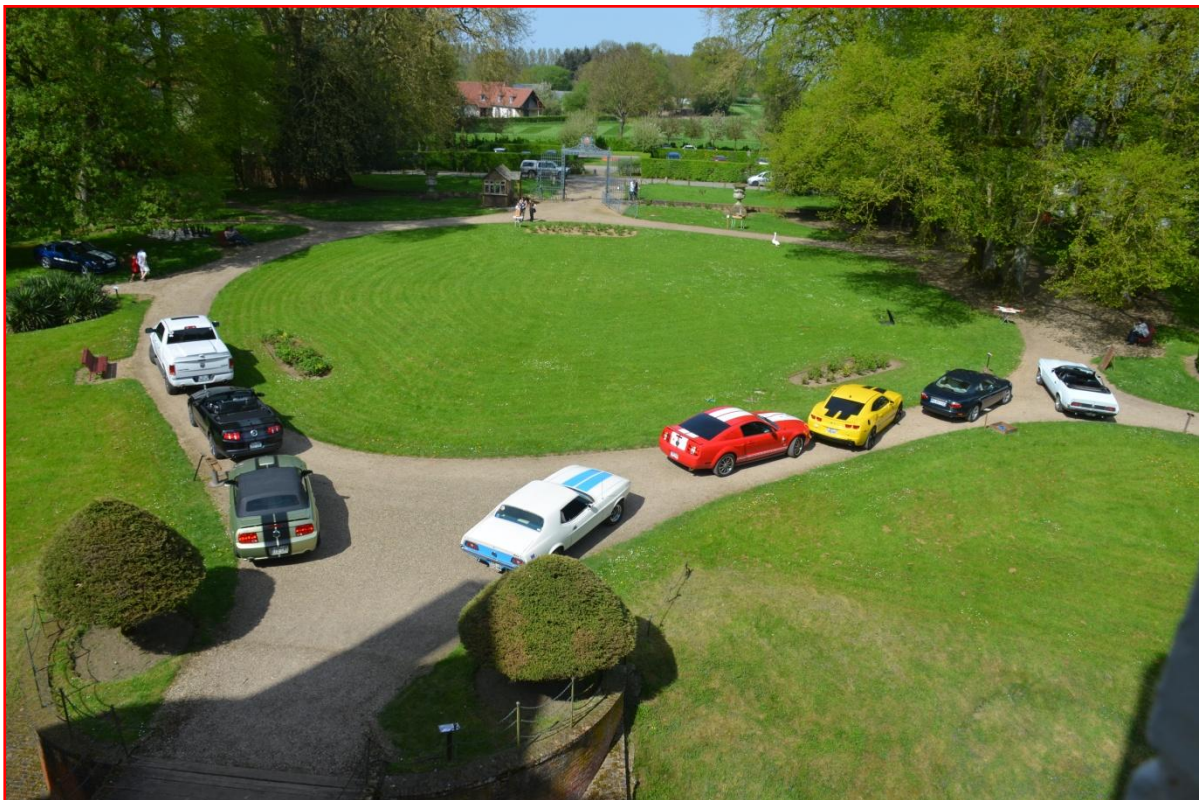
Une partie des jardins avec nos chevaux