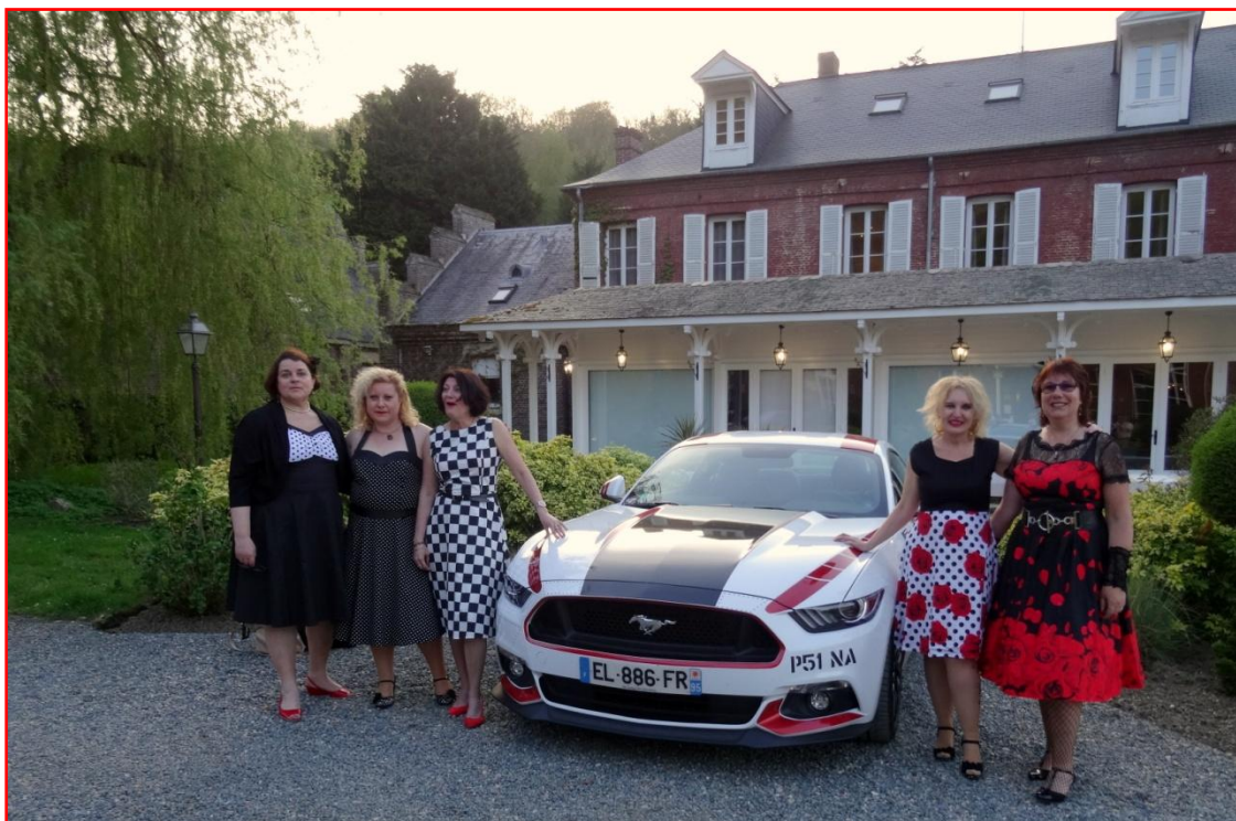
Nos Reines ont le sourire !