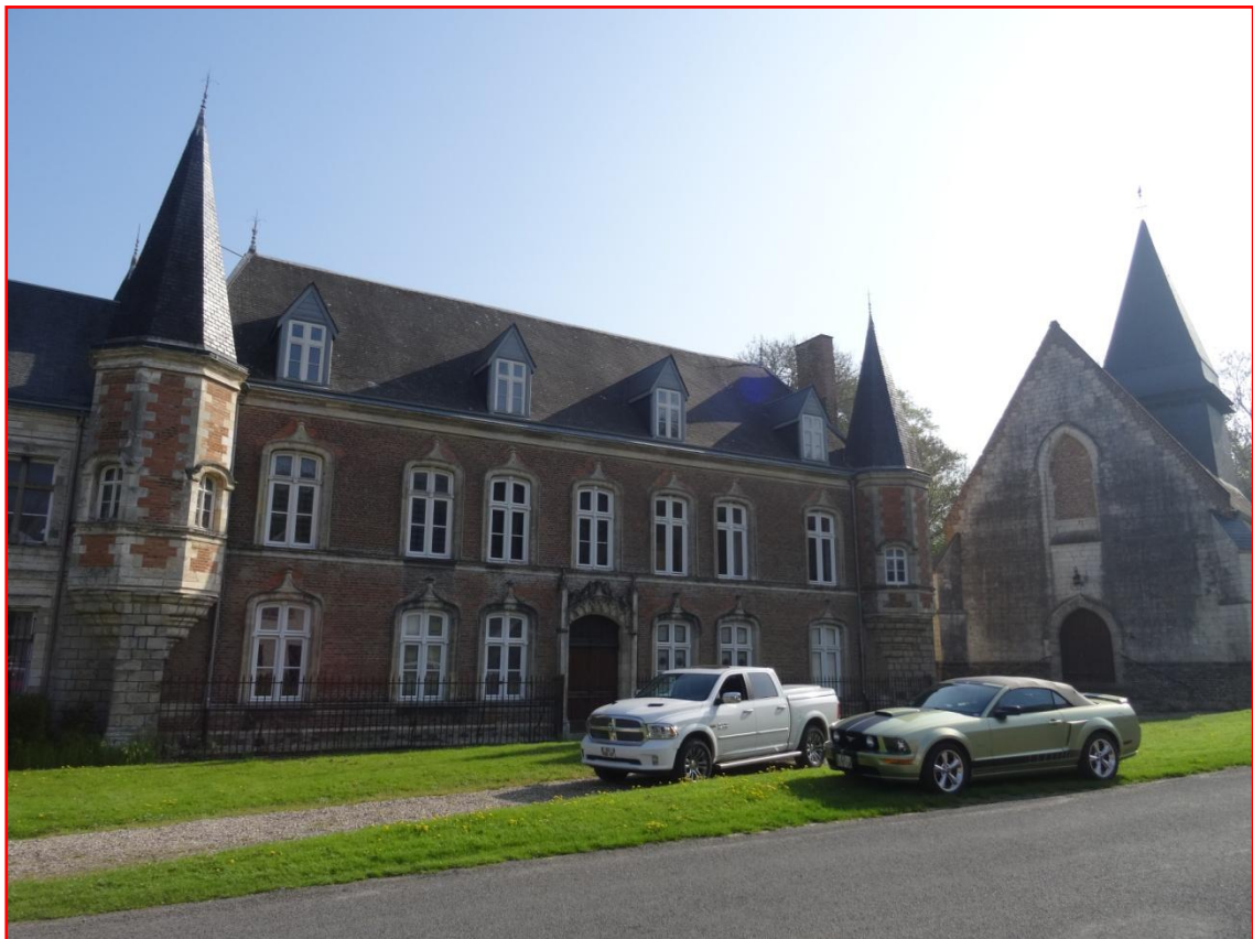
Nous découvrons quelques belles demeures