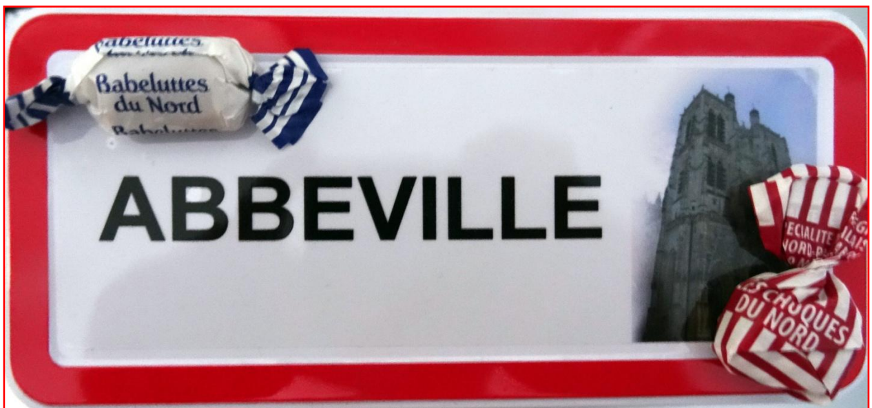
Les friandises de la région Nord Pas de Calais, les Babeluttes et les Chuques