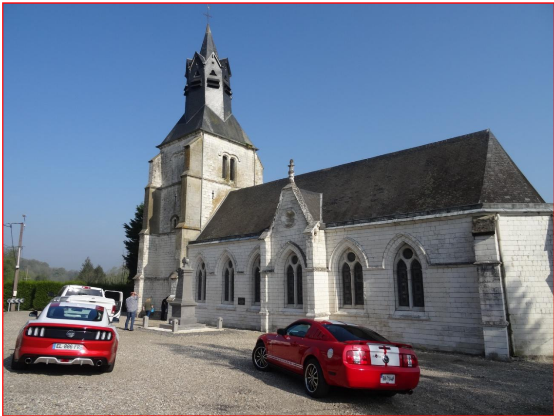
L'église Saint Denys, une autre partie du Quiz