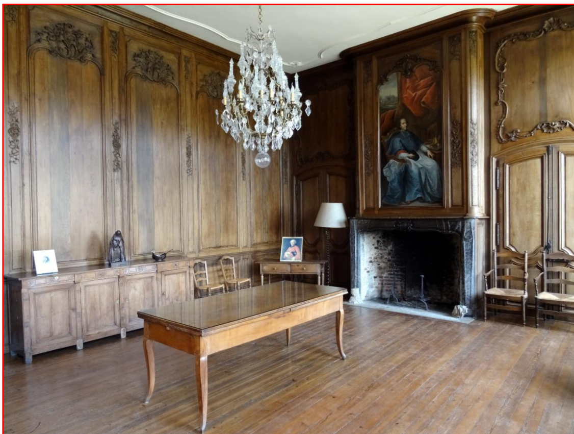
Lambris sculptés par le baron S. de Pfaffenhoffen