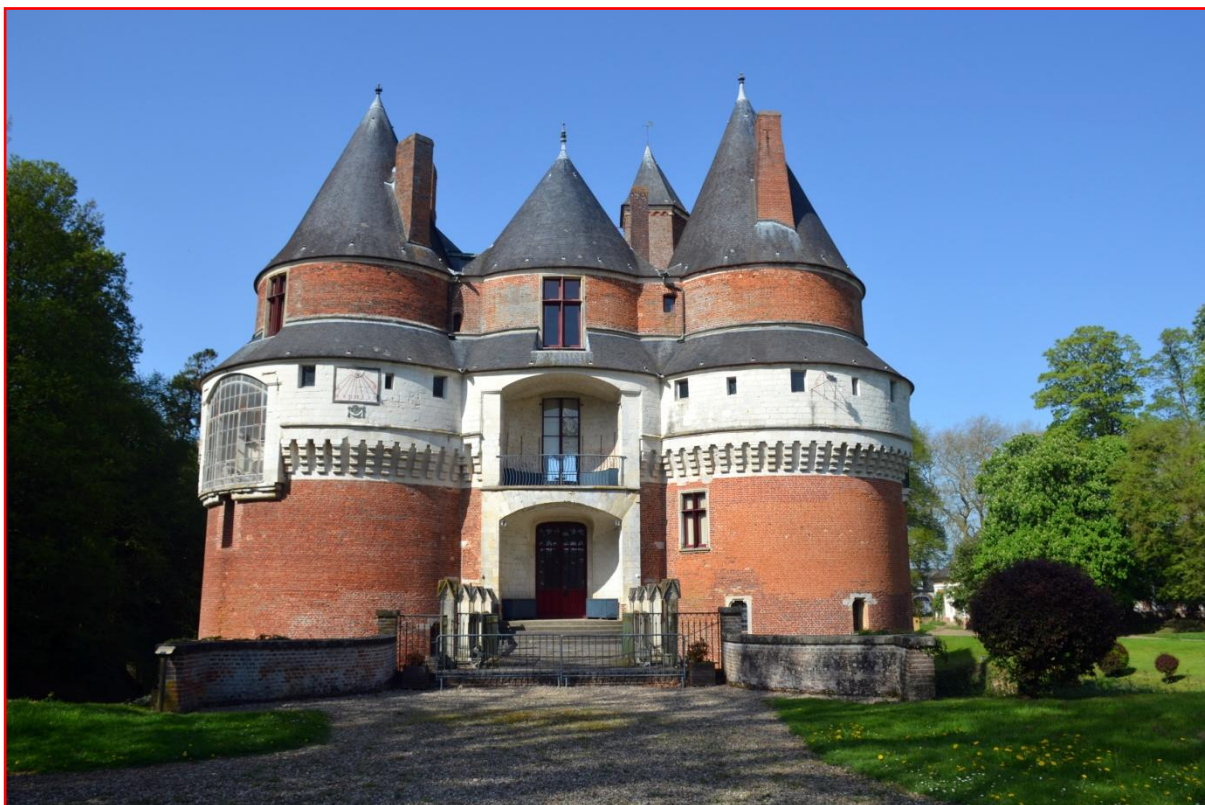
L'arrière du château de Rambures