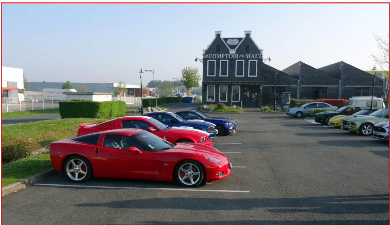
Nos américaines parkées devant le Comptoir de Malt