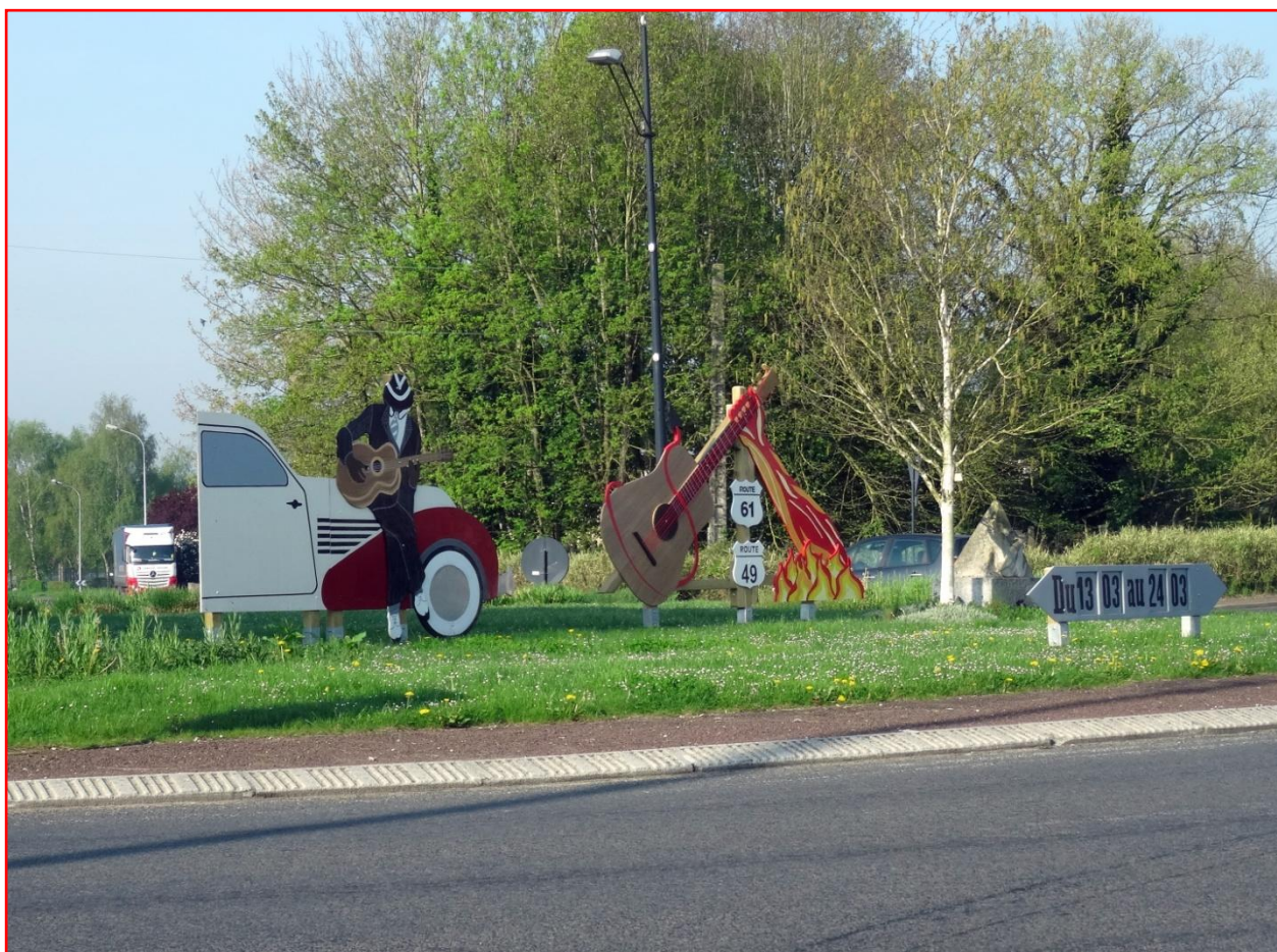
Au fil de la route