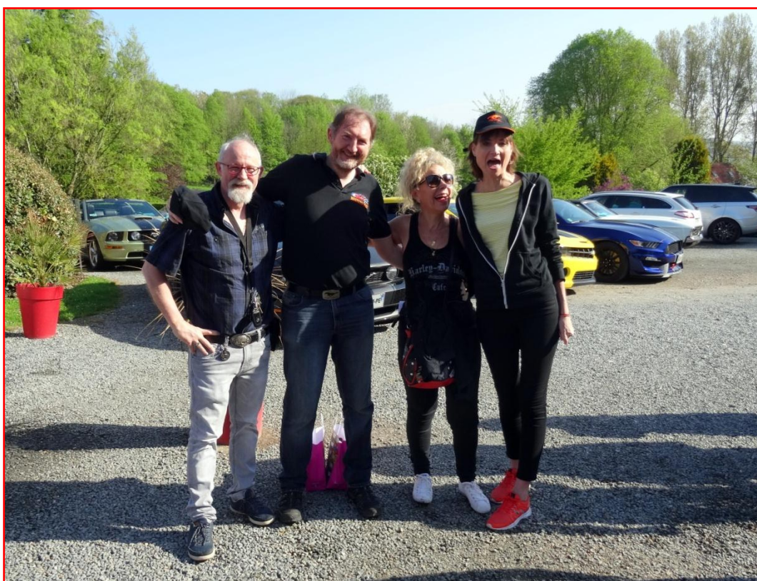
Toujours le sourire à l' US.CARS 78